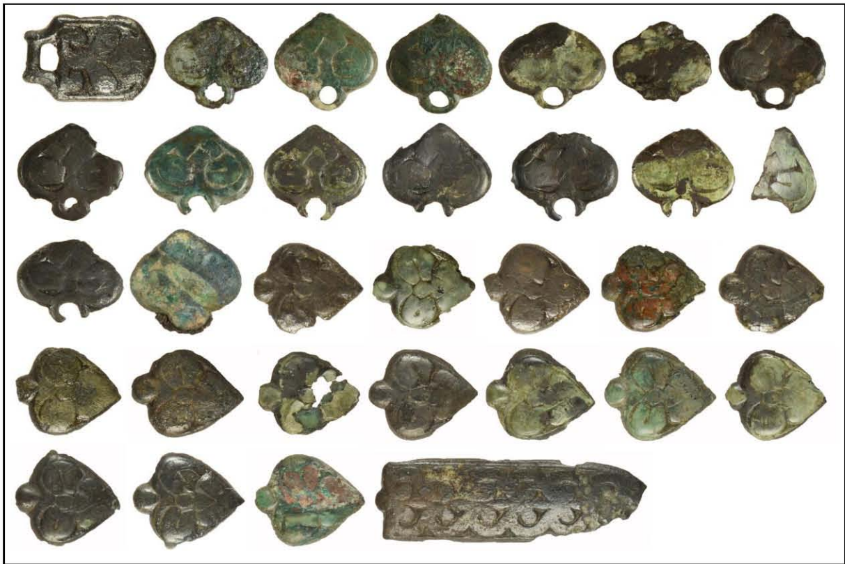
2. ábra Sárbogárd-Tringer-tanya 33. sír, övveretek, csat és szíjvég