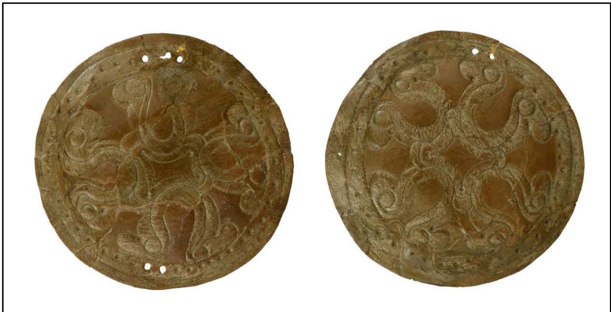
4. ábra Sárbogárd-Tringer-tanya 24. sír, hajfonatkorongok

Á.: 8,1 - 8,3 cm; v.: 0,2 cm. Ltsz.: SzIKM. 61.158.2–3.