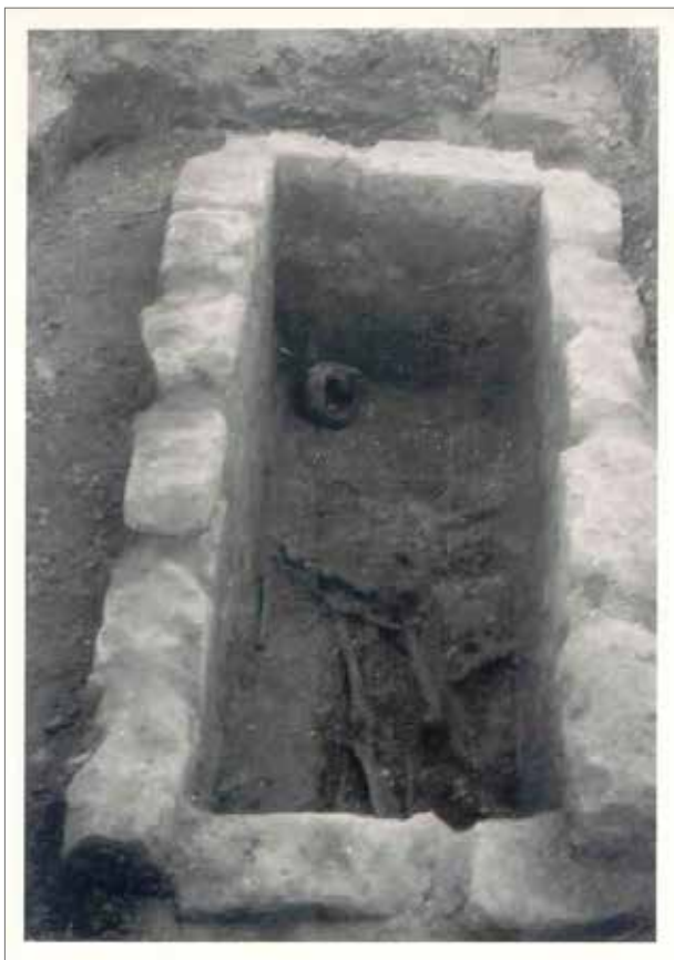
1. kép Pilisszentkereszt, 157. sír. A fotót Tilli Pál közvetlenül a feltárás után, 1981. május 22-én készítette.