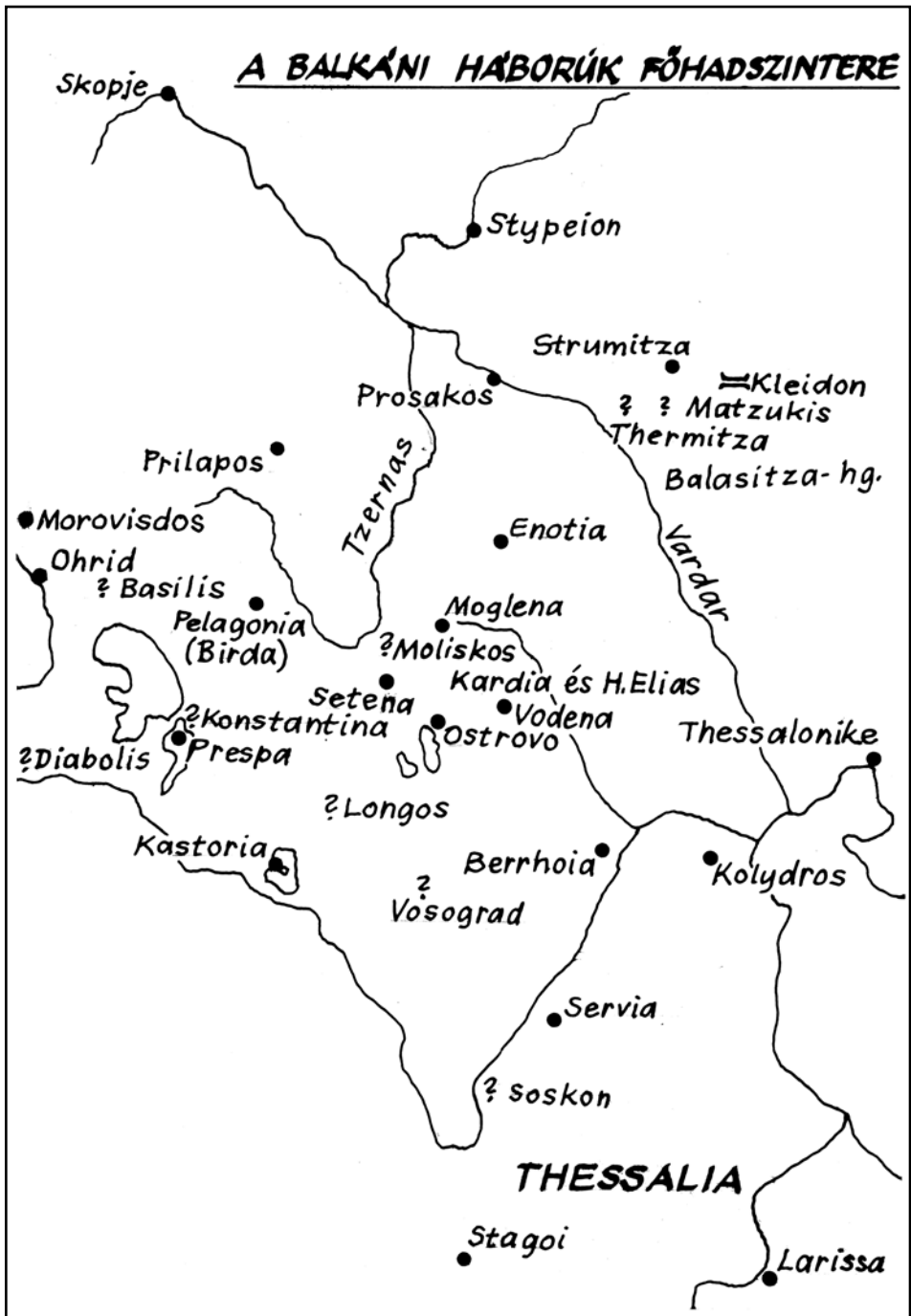
A balkáni háborúk