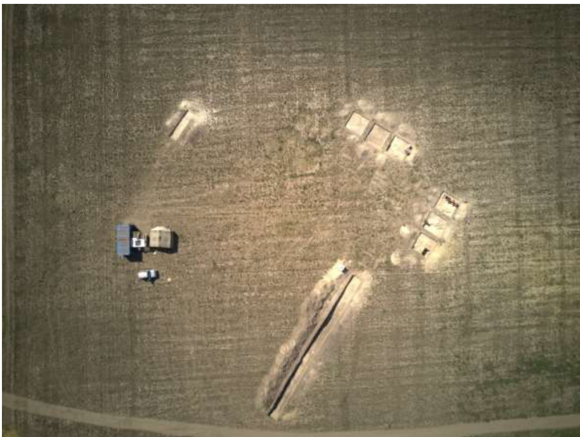
1. kép: Légifelvétel a solt-tételhegyi Várdombon feltárt szelvényekkel (Pelta Bt. drónfelvétele)