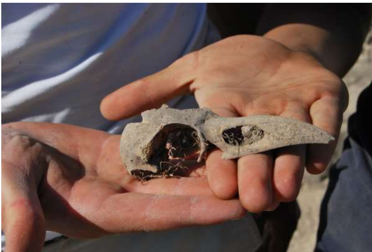
2. kép: Építési áldozat, madárcsontváz részlete egy cölöphelyből