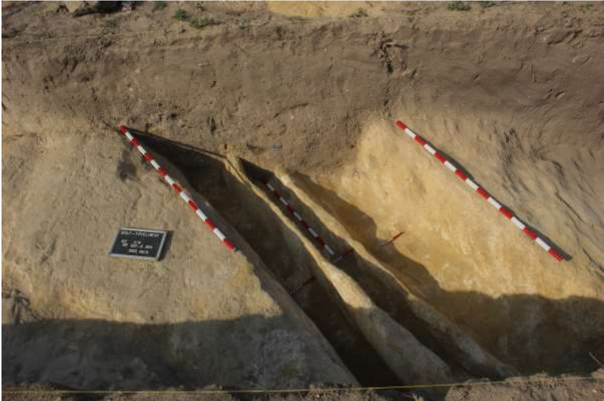
3. kép: Árpád-kori kettős árokszakas az II. felületen