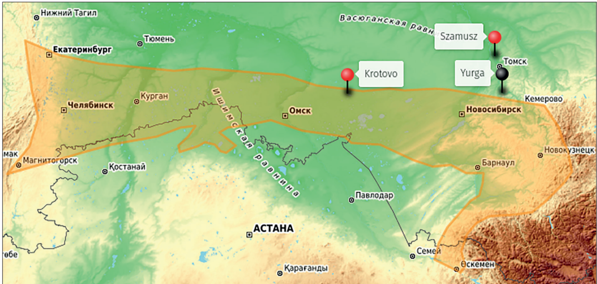
3. kép. A nyugat-szibériai erdős sztyeppe. A térkép az uMAP-alkalmazás segítségével készült a kazah erdős sztyeppe térképének felhasználásával.

The West Siberian forest-steppe. The map was created using the UMAP application using the Kazakh forest steppe map.