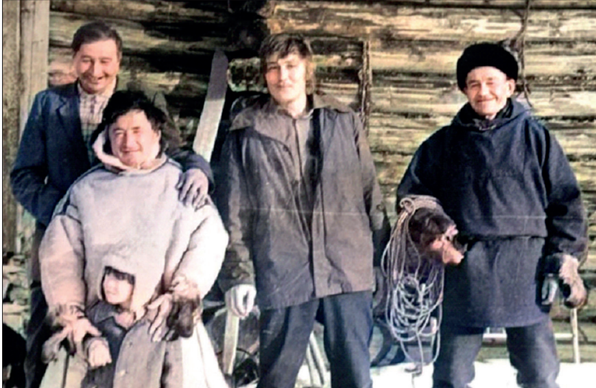
2. kép. Mansyi férfiak Fig. 2. Mansi men

portja, amelyik láthatóan helyben maradt, nem jött el a honfoglaló magyarok őseivel. Ezzel szemben az N-B540-nek és az N-B545-nek is van egy-egy olyan alcsoportja, amelyiknek nincs nyoma a Volga–Urál vidéken, a mai magyarokban viszont van. Nehéz a jelenséget mással magyarázni, mint a nemzetségi szervezet élő jellegével a magyar törzsszövetség nyugatra indulásának pillanatában.