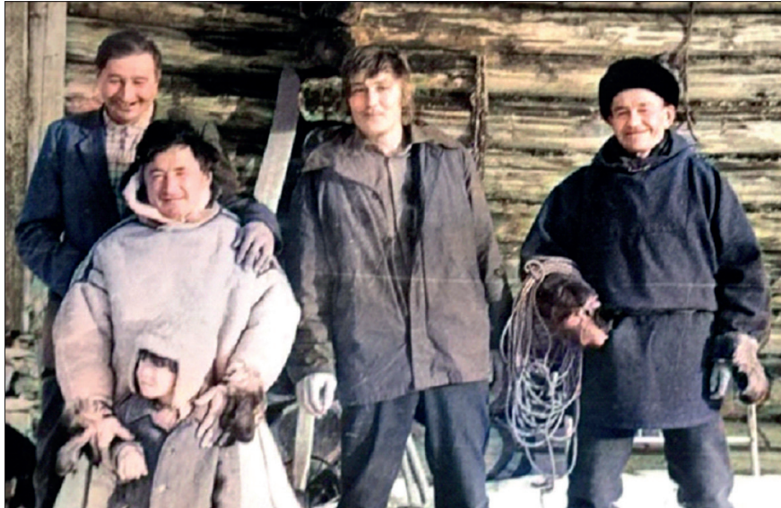
2. kép. Mansyi férfiak Fig. 2. Mansi men