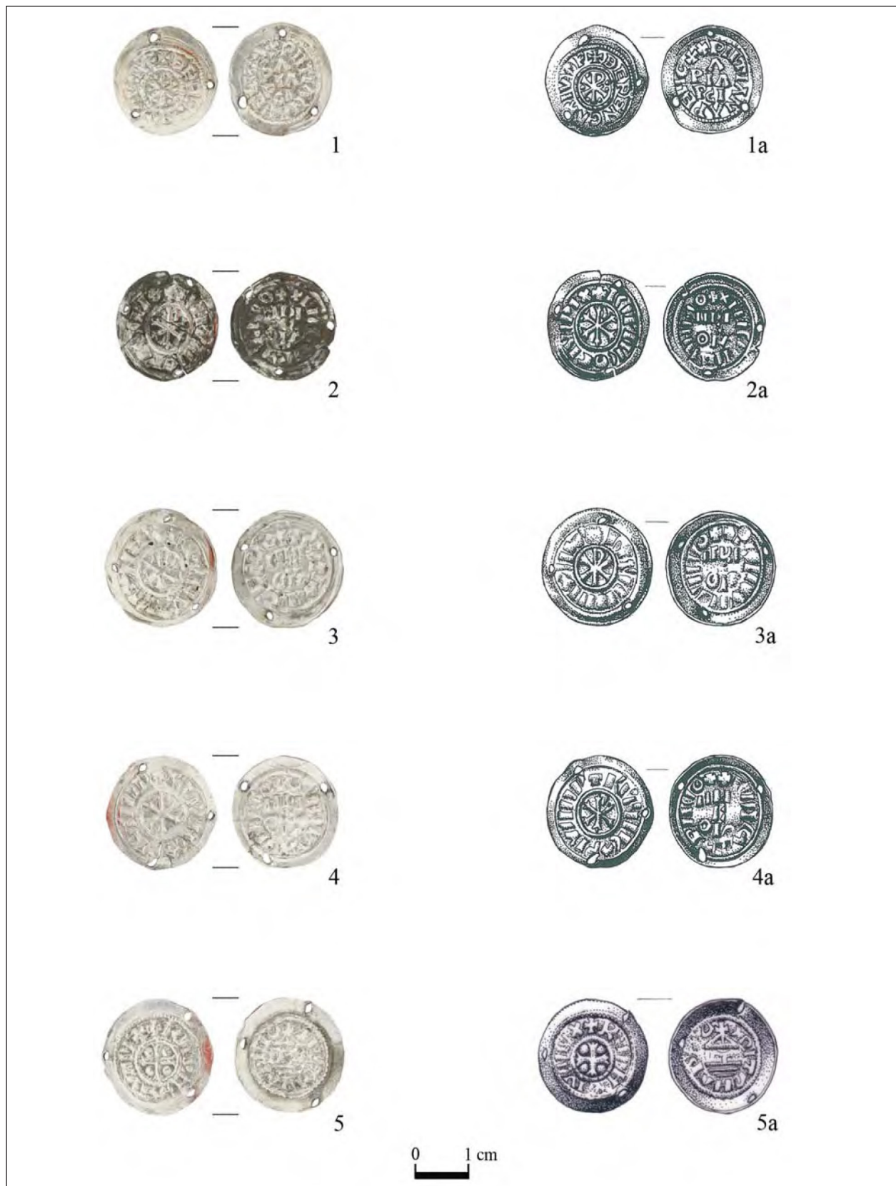
2. kép. Szeged-Öthalom, V. homokbánya, 187. sír