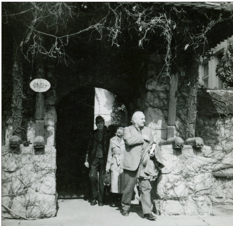
10. ábra László Gyula 1973-as látogatása a Székely Nemzeti Múzeumban