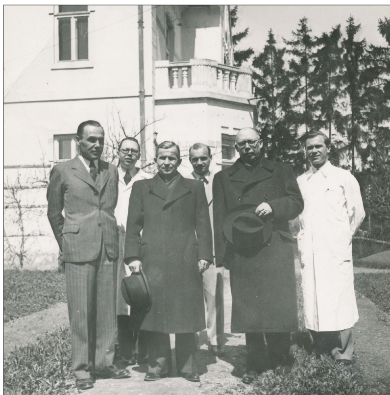
2. ábra László Gyula kolozsvári tudóstársaival, barátaival 1945–1949 között