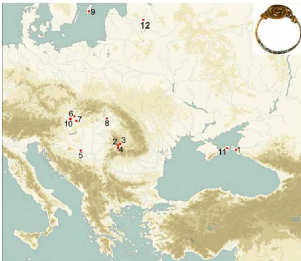
Рис. 5. Распространение перстней со спиральным щитком, аналогичных перстню из Андреевской щели.