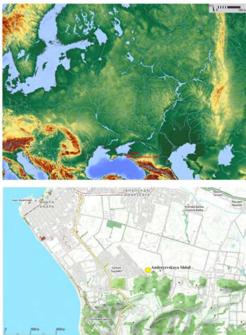
Рис. 1. Местоположение средневекового могильника Андреевская щель.