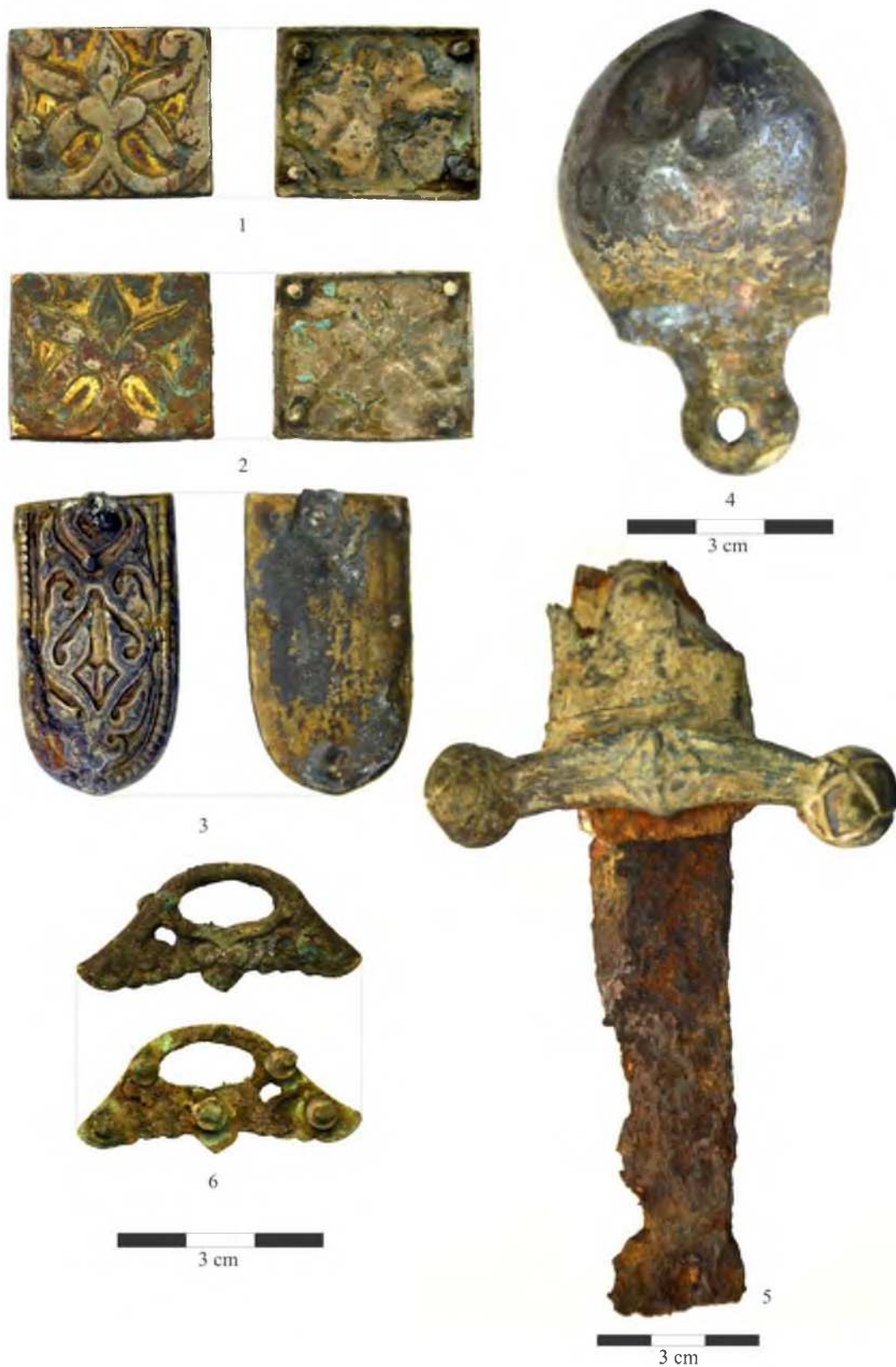
Рис. 2. Предметы из могильника Андреевская щель: 1–2 – поясные прямоугольные накладки, 3 – серебряный наконечник пояса с чернением, 4 – фрагмент навершия сабли, 5 – фрагмент сабли с перекрестием, 6 – петли киевского типа.