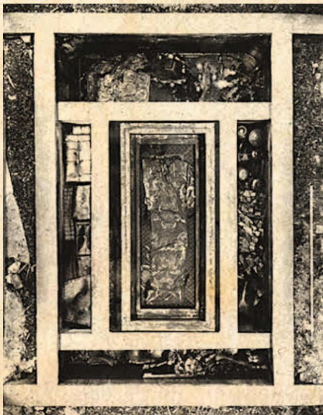
Dai úrnő sírkamrája. Kína, Mavangtuj, Hunan tartomány ( https://smarthistory.org/tomb-of-lady-dai/ .)