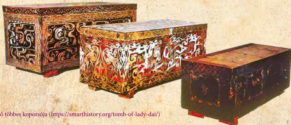
Dai úrnő többes koporsója ( https://smarthistory.org/tomb-of-lady-dai/ )

A folyó és a folyómeder az ókori Kína temetési rítusában is fontos szerepet játszott. A kínai történetíró, Szema C sien Történeti feljegyzések (Shi Ji) című munkája szerint az első kínai császár, Csin Si Huang-ti (Kr. e. 3. század) temetésénél a császár testét őrző többes koporsót egy föld alatti forrásban helyezték el, majd higanyfolyókat készítettek, amelyekkel a Sárga és a Jangce folyókat jelképezték: