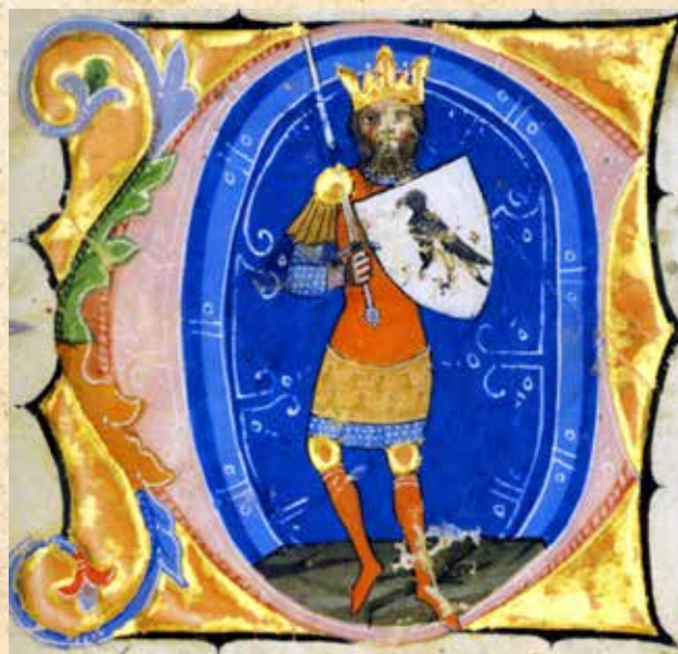
Attila ábrázolása a Képes Krónikában

A 13–14. századi német krónikák, a Szász Világkrónika és Heinrich von München rimes világkrónikája szerint Attilát a Tisza folyó medrében arany- és ezüstkoporsóban helyezték végső nyugalomra. A magyar színhagyományban fennmaradt mondaváltozatban a hun nagykirályt „ napsugárba, holdsugárba, fekete éjszakába ” temették, amellyel a három fémkoporsót, az aranyat, az ezüstöt és a vasat szimbolizálták. A kínai és a lovasnomád kultúrkörben a vas a hatalmat, míg az arany a nap szimbólumaként, az ezüst pedig a hold jelképeként az égi származást je-