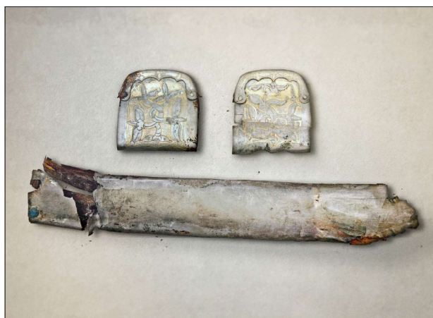
5. Palmetta mintás aranyozott ezüstszerelékű szablya a Kubán-vidékről (RU, Krasznodari Tájvédelmi Múzeum)

Az expedíció tagjai 2017. május 31 és június 2 között Krasznodarban részt vettek egy háromnapos nemzetközi konferencián is, ahol a tavalyi Észak-kaukázusi kutatóút eredményeiről számoltak be. A kutatócsoport arra hívta fel a résztvevő oroszországi tudósok figyelmét, hogy a Kaukázus északi előtere mennyire fontos magyar őstörténeti szempontból, ezért együttműködésre buzdították a jelenlévő szakembereket. Megállapodtak abban is, hogy a közeljövőben közösen publikálják az eddig felgyűjtött honfoglaló magyar jellegű leleteket.