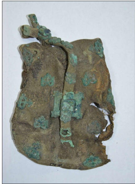
3. Veretes tarsoly Martan Ču 10. katakombasírijából (RU, Csecsenföld)

Bár a térségben komoly problémát jelent az illegális műkincs-kereskedelem (a 2016-ban dokumentált legérdekesebb lelet-együttesek java része is az illegális műkincspiacról került hatósági lefoglalás után múzeumba), egyre bővül azoknak a lelőhelyeknek a száma is, ahol szakszerű régészeti feltárás folyt. 2 Tanulságos volt a grozniji látogatás is, ahol az újonnan épült Csecsen Nemzeti Múzeumban a V. B. Vinogradov által az 1980-as évek elején már publikált Martan Ču-i katakombasírok honfoglaló magyar jellegű leletei (VINOGRAĐOV 1983, 211–220.) közül csak a veretes tarsolyt sikerült eredetiben tanulmányozni. A többi tárgy a pár évvel ezelőtti orosz-csecsen háború alatt az épületet ért bombatámadás miatt sajnos megsemmisült.