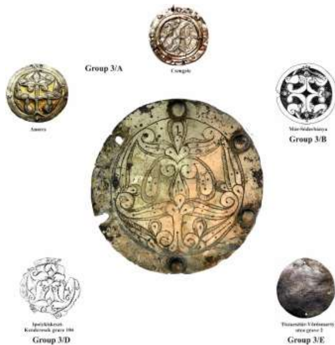
7. Az Andrejevszkaja scseli hajfonatkorong és Kárpát-medencei párhuzamai (Anarcs, Csengele, Mór-Sóderbánya, Ipolykiskeszi, Tiszaeszlár – Vörösmarty utca)