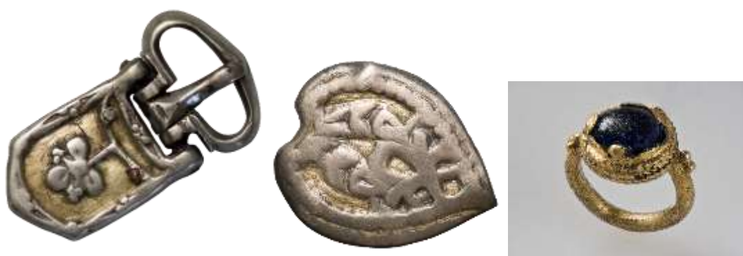
5. Szórványleletek az Északnyugat-Kaukázusból (válogatás)