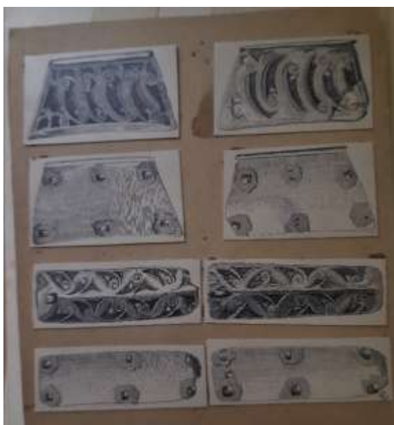
3. A Kubán-vidéki Andrjukovszkaja sztanyica leletei, Pósta Béla rajza a III. Zichy-expedíció (1897–1898).