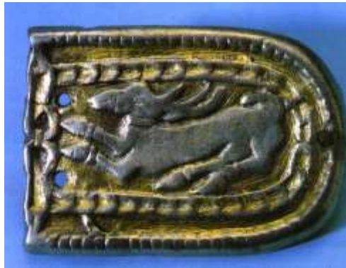
1. A törteli szarvasos szíjvég Pósta Béla 1896-os ásatásából (MNM Régészeti Tár)