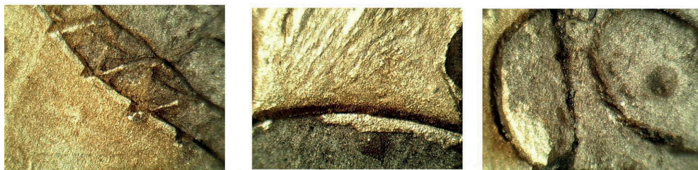
Рис. 7. Микроснимки фрагментов лицевой стороны накладки.