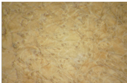
Рис. 2. А – микроснимок образца кожи от сумочки из погр. 8 Красногорского могильника; Б – фото овцы породы «гаска»; В – эталонный образец мерей овцы породы «гаска».