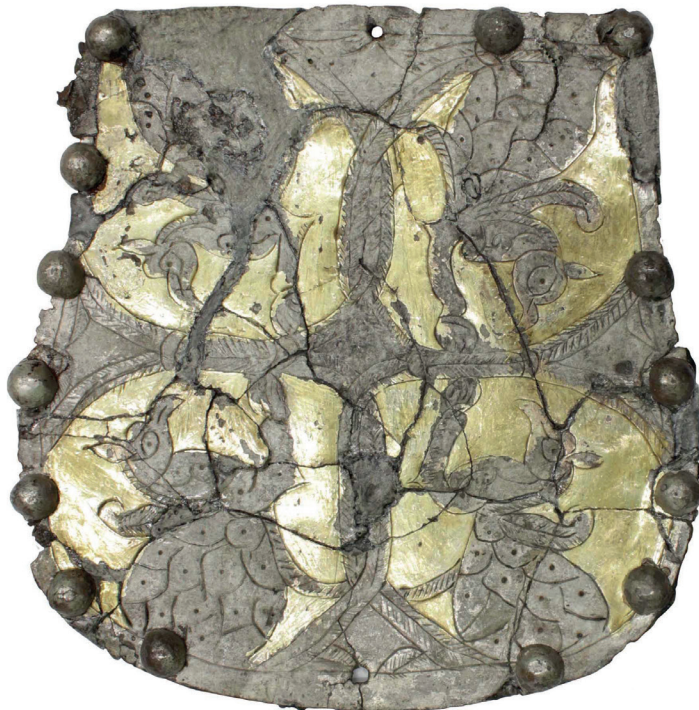
Рис. 6. Металлическая пластина на крышке кошелька из погр. 8 Красногорского могильника.