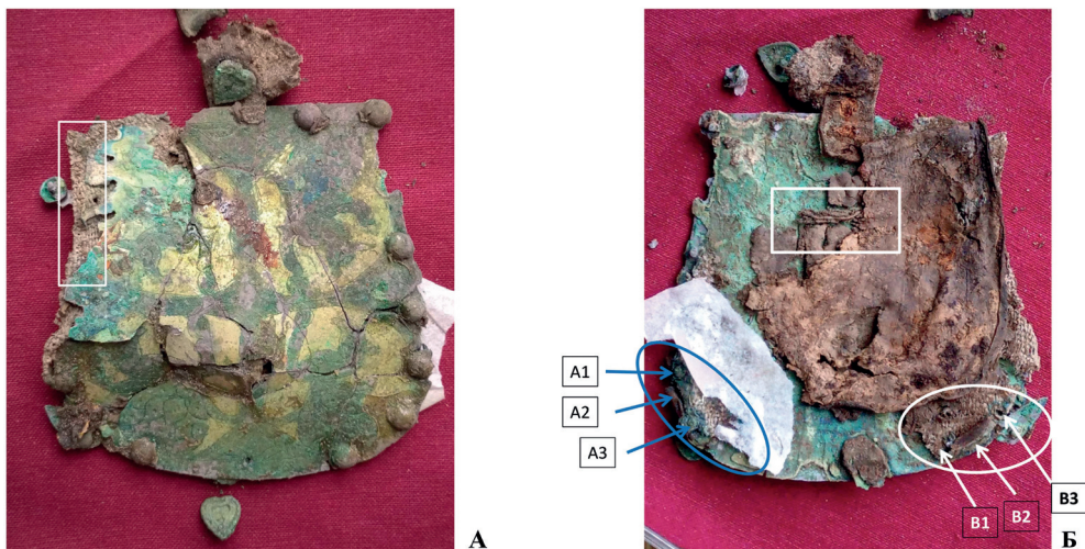
Рис. 1. Первоначальный вид накладки из погребения 8 Красногорского могильника. А – лицевая сторона; Б – обратная сторона.