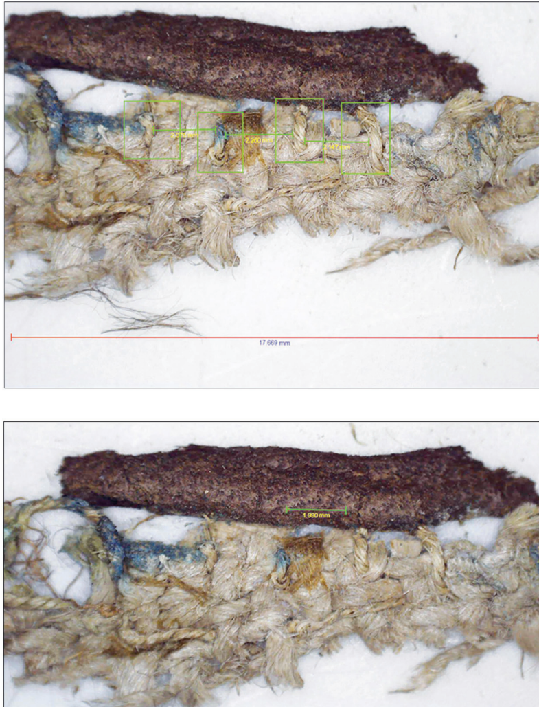
Рис. 4. Структура ткани на подкладке металлической пластины. Fig. 4. Structure of the fabric on the lining of the metal plate.

нами) показывает, что «клей, который можно легко изготовить из натурального сырья в домашних условиях. Готовое склеивание будет водонепроницаемым и не термочувствительным. Время прессования составляет 4–6 часов, достижение полного склеивания составляет не менее 1 недели. В Венгрии это был широко используемый клей, особенно у производителей народной мебели. Он также часто использовался для основания расписной мебели... Окрашенные земляными красками или солями металлов, мы