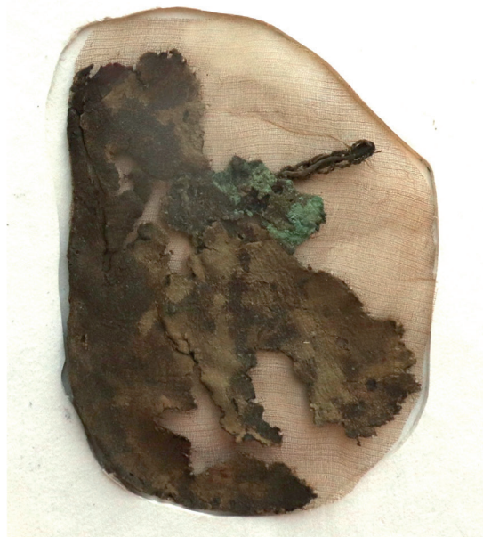
Рис. 8. Кожаный фрагмент с накладки после консервации.