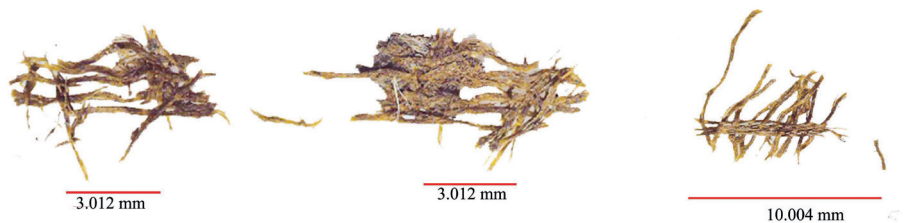
Рис. 5. Волокна шелка.