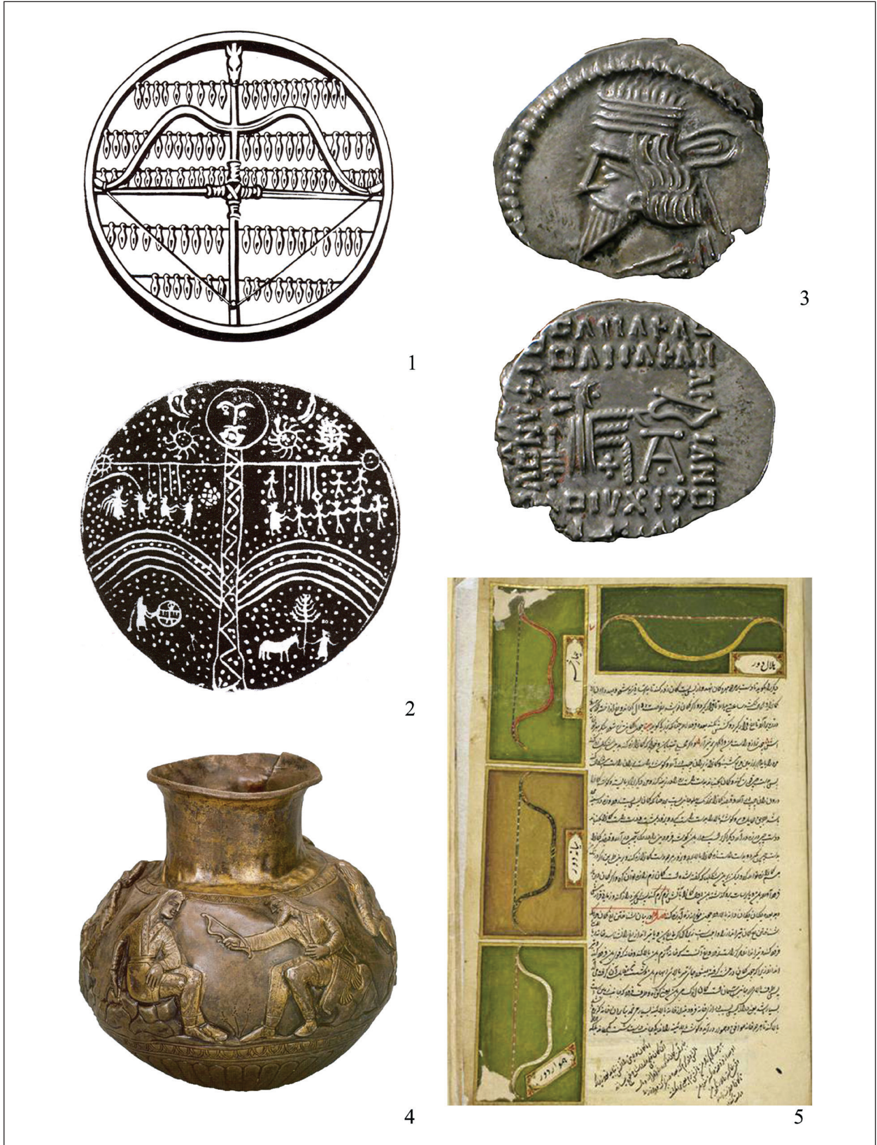
3. kép. 1: Mongol íjas sámándob; 2: Altaji íjas-emberalakos sámándob; 3: Pártus érme a Kr. e. 3. századból; 4: A Voronyezs melletti Csasztije kurgán szkíta kori ezüstedénye (Kr. e. 4. század)